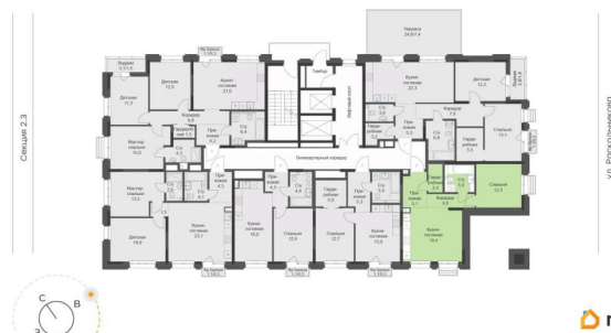
Дом, Секция 2.1