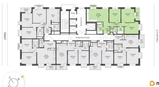
Секция 2.5, Двор